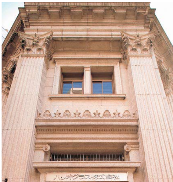
日本橋本社ビル（登録有形文化財）