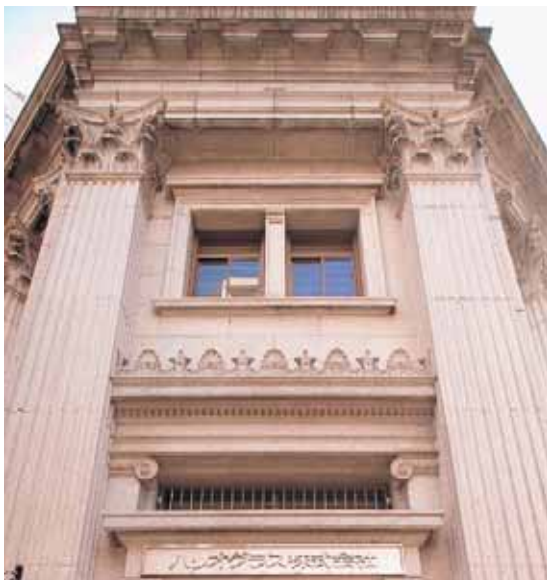
日本橋本社ビル（登録有形文化財）