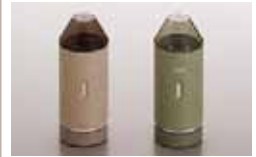
電動コーヒーミル シャトル