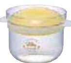
耐熱ガラス製 レンジ釜