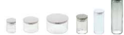
・ドライウェア ・ドライテンダー