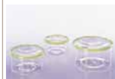
・サイクル ウェア