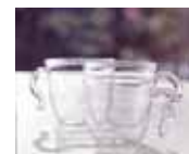
・スタックカップ