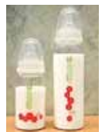
・色でお知らせ！ 飲みごろチェック哺乳瓶