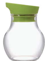
ニューバ・調味料入れフラット 120 NCF-120KG