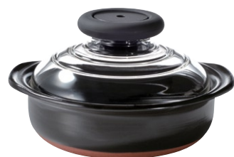
NEW フタがガラスの土鍋 6号 MN-165B

C/T12 803701 幅 210・奥 190・高 120 口径 165 満水容量 750ml