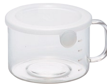
とっても便利 M80 PWT-M80TW

C/T24 419612 幅 140・奥 116・高 112 口径 105 満水容量 850ml