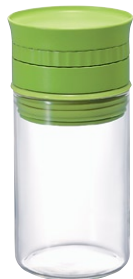
ヌーバ・計量スパイスストッカー NSS-M-KG

C/T36 811829 径 59・高 118 口径 55 実用容量 (塩 100 g)