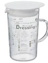
アキコズッキングメジャー味自慢・ドレッシング AMJ-200 G

C/T48 930803 幅 110・奥 79・高 118 口径 70 実用容量 200ml