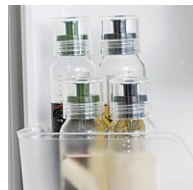
冷蔵庫のドアポケット で保存