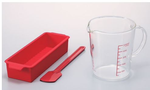
スイーツ&デリキット SKT-1R