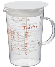
アキコズッキングメジャー味自慢・たれ AMJ-500 OR

C/T48 930810 幅 110・奥 79・高 118 口径 70 実用容量 200ml