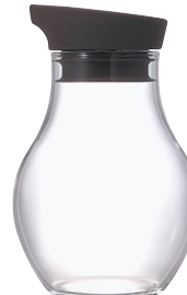
ニューバ・調味料入れフラット 180 NCF-180CGR

C/T36 811447 径 74・高 114 口径 44 実用容量 180ml