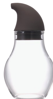
ニューバ・調味料入れドロップ 180 NCD-180CGR

C/T36 811348 径 74・高 135 口径 44 実用容量 180ml 2010 年度グッドデザイン賞受賞