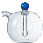
しょうゆさし・丸 SUM-1BU

C/T24 013261 幅 72・奥 53・高 75 口径 20 実用容量 84ml