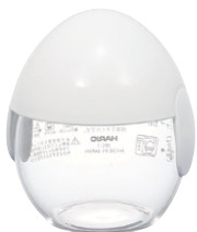
イースタイル たまごクッカー XEC-1WES

C/T36 756601 幅 80・奥 74・高 89 口径 63 実用容量 150ml たまご 1 個用 フタをしたまま電子レンジOK 材質：フタ/ポリプロピレン