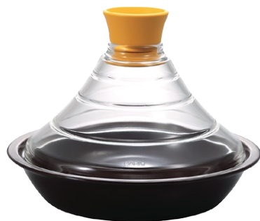
フタがガラスのタジン鍋 TN-200MY

C/T6 803107 径 230・高 170 口径 200 満水容量 600ml