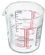
メジャーカップ 200 CMJ-200

C/T24 530300 幅 86・奥 81・高 87 口径 81 実用容量 200ml