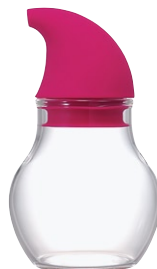
ニューバ・調味料入れドロップ 120 NCD-120PC

C/T36 811324 径 68・高 115 口径 44 実用容量 120ml 2010 年度グッドデザイン賞受賞