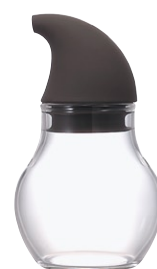
ニューバ・調味料入れドロップ 120 NCD-120CGR

C/T36 811317 径 68・高 115 口径 44 実用容量 120ml 2010 年度グッドデザイン賞受賞