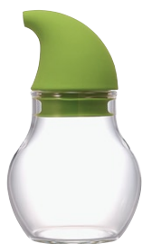
ニューバ・調味料入れドロップ 120 NCD-120KG

C/T36 811324 径 68・高 115 口径 44 実用容量 120ml 2010 年度グッドデザイン賞受賞