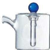
しょうゆさし・角 SUK-1BU

C/T24 013261 幅 72・奥 53・高 75 口径 20 実用容量 84ml