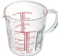
メジャーカップワイド 200 CMJW-200

C/T24 530317 幅 99・奥 91・高 145 口径 91 実用容量 500ml