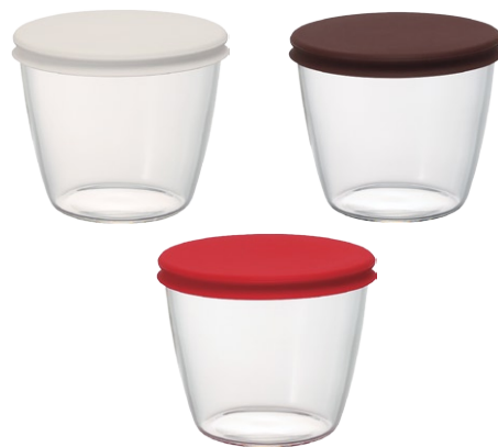
スイーツカップ3色セット SWC-1518