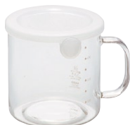
とっても便利 S70 PWT-S70TW

C/T24 419605 幅 140・奥 116・高 83 口径 105 満水容量 600ml