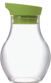
ニューバ・調味料入れフラット 180 NCF-180KG

C/T36 811454 径 74・高 114 口径 44 実用容量 180ml