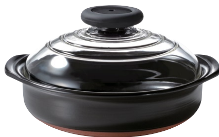
NEW フタがガラスの土鍋 8号 MN-225B

C/T12 803701 幅 210・奥 190・高 120 口径 165 満水容量 750ml