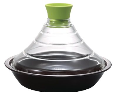
フタがガラスのタジン鍋 TN-200GP

C/T6 803114 径 230・高 170 口径 200 満水容量 600ml