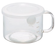
とっても便利 S40 PWT-S40TW

C/T24 419605 幅 140・奥 116・高 83 口径 105 満水容量 600ml