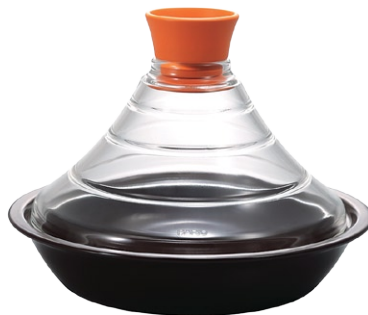
フタがガラスのタジン鍋 TN-200COR

C/T6 803107 径 230・高 170 口径 200 満水容量 600ml