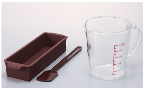
スイーツ&デリキット SKT-1CBR