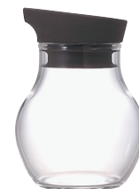
ニューバ・調味料入れフラット 120 NCF-120CGR