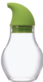
ニューバ・調味料入れドロップ 180 NCD-180KG

C/T36 811300 径 68・高 115 口径 44 実用容量 120ml 2010 年度グッドデザイン賞受賞