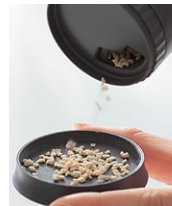
上キャップの裏面に振り出せます