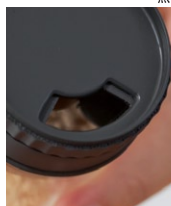
ダイレクトに振り出せる口

*小さじ 1/2 を計量する場合は振り出し口を閉めた状態で 180°逆さまにします。そしてもとの状態に戻し、「小さじ 1/2」の位置に振り出し口を回します。