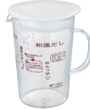
アキコズッキングメジャー味自慢・和風だし AMJ-500 HR

C/T24 930834 幅 133・奥 98・高 139 口径 90 実用容量 500ml (目盛容量 460ml)