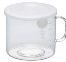
とっても便利 M120 PWT-M120TW

C/T24 419629 幅 167・奥 143・高 94 口径 131 満水容量 1,100ml