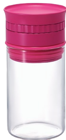
ヌーバ・計量スパイスストッカー NSS-M-PC

C/T36 811829 径 59・高 118 口径 55 実用容量 (塩 100 g)