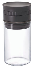
ヌーバ・計量スパイスストッカー NSS-M-CGR

C/T36 811812 径 59・高 118 口径 55 実用容量 (塩 100 g)