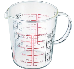
メジャーカップワイド 500 CMJW-500

C/T24 530331 幅 118・奥 81・高 87 口径 81 実用容量 200ml