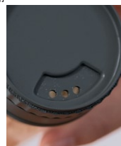
塩などを振り出せる 3つ口