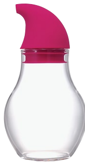
ニューバ・調味料入れドロップ 180 NCD-180PC

C/T36 811355 径 74・高 135 口径 44 実用容量 180ml 2010 年度グッドデザイン賞受賞