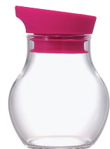
ニューバ・調味料入れフラット 120 NCF-120PC