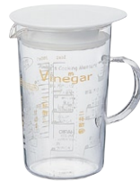
アキコズッキングメジャー味自慢・酢 AMJ-200 Y

著書：「きょうはカレーとっておきのレシピ 40」(永岡書店)、 「たれ・ソース&ドレッシング使いこなしBOOK」(主婦と生活社)、 「きれいになるおかゆレシピ」(成美堂書店)、「からだの芯から温まるレシピ」(成美堂書店)