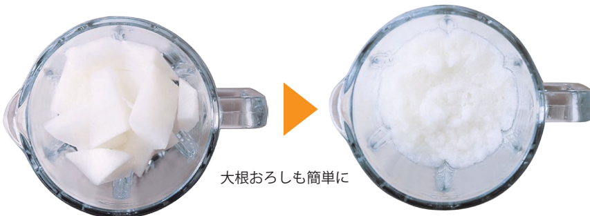
大根おろしも簡単に