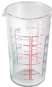
メジャーカップ 500 CMJ-500

C/T24 530300 幅 86・奥 81・高 87 口径 81 実用容量 200ml