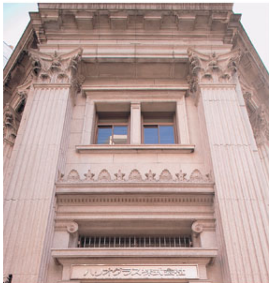
日本橋本社ビル（登録有形文化財）