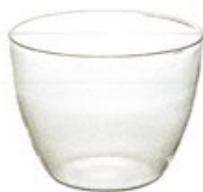
New サラダ&デリボウル 6 SDB-6

C/T36 420403 径105・高80 口径105 実用容量 300ml 満水容量 460ml