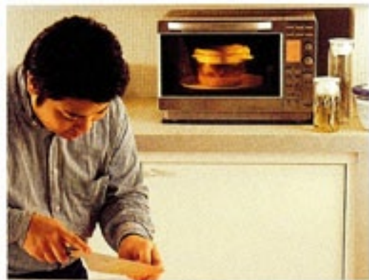
レンジでおかずとごはん