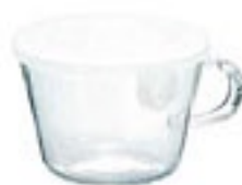
New ととっても便利 SS15 PWT-SS15TW

C/T36 419667 幅 116・奥 93・高 64 口径 86 実用容量 150ml 満水容量 240ml 材質：フタ/ポリプロピレン