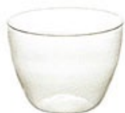
New サラダ&デリボウル 3 SDB-3

C/T36 420403 径105・高80 口径105 実用容量 300ml 満水容量 460ml