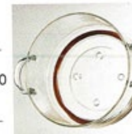
上段にはスチーム 用の穴開き加工。