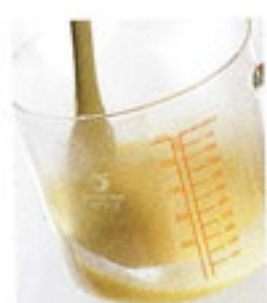
基本ソースのレシピ 付きです。

New レンジで楽うま! スープ&ソースポット RSS-120-OPS C/T24 540095 幅166・奥136・高130 口径131 実用容量1,200ml 満水容量1,450ml 材質: フタ/ポリプロピレン フタパッキン/シリコンゴム