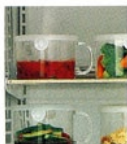
冷蔵庫から 取り出しやすい