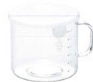
New ととっても便利 M120 PWT-M120TW

C/T24 419629 幅 167・奥 143・高 94 口径 131 実用容量 800ml 満水容量 1,100ml 材質：フタ/ポリプロピレン