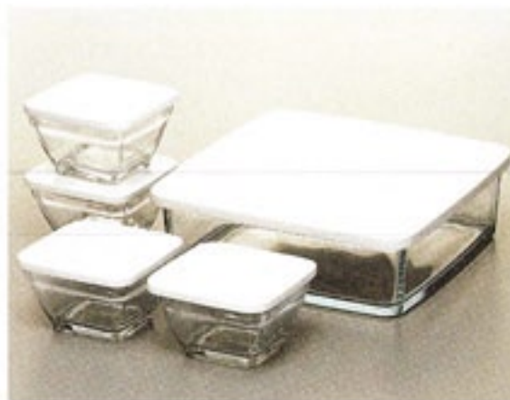
角鉢 5 点セット KOB-5706

C/T12 802827 KKB-3W・3 個 トレー フタを外してオープンOK 材質：フタ/ポリプロピレン トレー/天然木（サイズ：幅 320・奥 105・高 20）