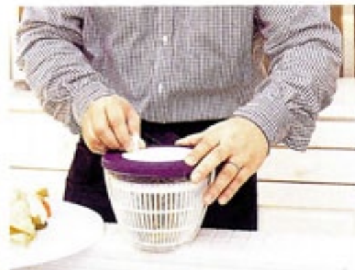
サラダボウルドライヤー