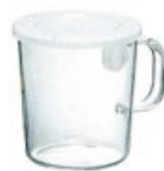
New ととっても便利 SS30 PWT-SS30TW

C/T36 419667 幅 116・奥 93・高 64 口径 86 実用容量 150ml 満水容量 240ml 材質：フタ/ポリプロピレン