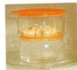
フタをしたまま電子 レンジOK。

New レンジで楽うま! ダブルクッキングスチーマー RDS-2-OPS C/T12 540132 幅207・奥166・高156 口径160 実用容量600ml 満水容量1,300ml 材質: フタ/ポリプロピレン フタパッキン・上段ガラスパッキン /シリコンゴム