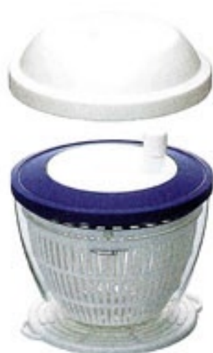
栗原心平・サラダボウルドライヤー SBD-1WKS

C/T12 150546 径 173・高 162 (フタ装着時) 口径 164 実用容量 1,200ml 満水容量 1,700ml