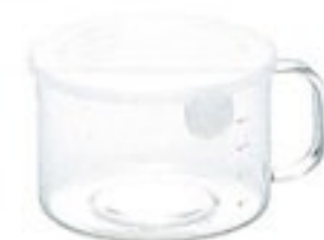
New ととっても便利 M80 PWT-M80TW

C/T24 419612 幅 140・奥 116・高 112 口径 105 実用容量 700ml 満水容量 850ml 材質：フタ/ポリプロピレン