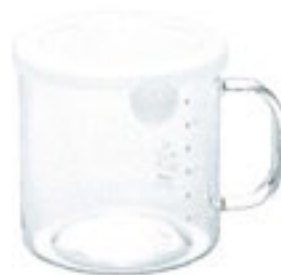
New ととっても便利 S70 PWT-S70TW

C/T24 419605 幅 140・奥 116・高 83 口径 105 実用容量 400ml 満水容量 600ml 材質：フタ/ポリプロピレン