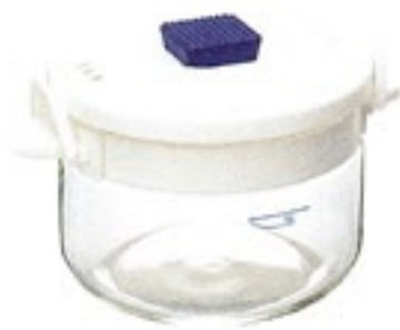
栗原心平・レンジでおかずとごはん XRC-2WKS

C/T12 150522 幅 228・奥 170・高 136 口径 162 実用容量 1,400ml 1～2合用 満水容量 2,000ml