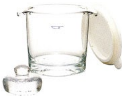
栗原心平・サラダ漬け器 GTK-1WKS

C/T6 150539 幅 165・奥 135・高 130 口径 132 実用容量 800ml 満水容量 1,000ml