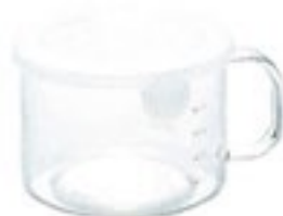
New ととっても便利 S40 PWT-S40TW

C/T24 419605 幅 140・奥 116・高 83 口径 105 実用容量 400ml 満水容量 600ml 材質：フタ/ポリプロピレン