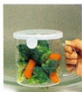
電子レンジから 取り出しやすい

C/T24 419636 幅 167・奥 143・高 123 口径 131 実用容量 1,200ml 満水容量 1,450ml 材質：フタ/ポリプロピレン