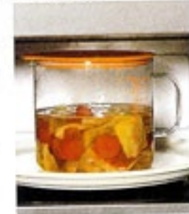
フタをしたまま電子 レンジOK。