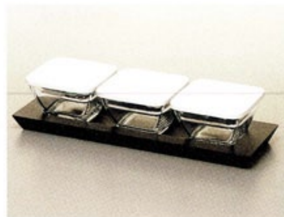
角小鉢 3 個トレーセット KKB-3012

C/T12 802827 KKB-3W・3 個 トレー フタを外してオープンOK 材質：フタ/ポリプロピレン トレー/天然木（サイズ：幅 320・奥 105・高 20）