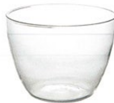
New サラダ&デリボウル 12 SDB-12

C/T36 420410 径131・高100 口径131 実用容量 600ml 満水容量 900ml