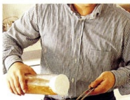
水出しだしポット