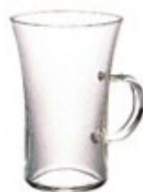
耐熱ホットグラス すき HGT-2T

C/T48 429413 幅 97・奥 76・高 107 口径 76 実用容量 200ml (7oz) 満水容量 240ml