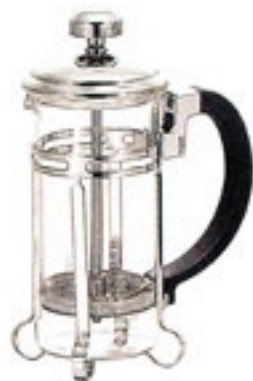
ハリオール・オーレ THA-2SV

材質：フタ・シャフト・フィルター式・ホルダー / ステンレス フタツマミ・ハンドル / ABS樹脂