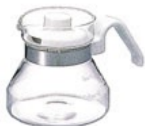
ティーポット・モーニング MO-2W

C/T24 314870 幅160・奥110・高110 口径77 実用容量300ml 2～3杯用 バンド下容量380ml