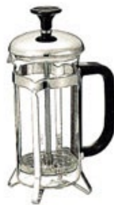
ハリオール・ドゥ THX-2SV

C/T12 104815 幅 120・奥 80・高 190 口径 73 実用容量 300ml 2杯用 満水容量 395ml