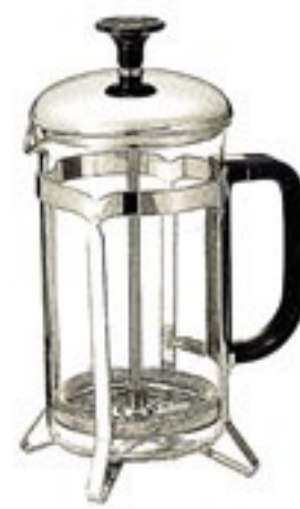
ハリオール・ドゥ THX-4SV

材質：フタ・シャフト・フィルター式・ホルダー / ステンレス フタツマミ・ハンドル / ABS樹脂