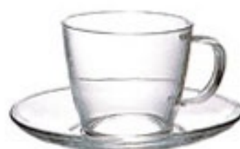
耐熱コーヒーカップ&ソーサー CCS-1T

C/T24 440203 カップ：幅 115・奥 93・高 55 口径 93 ソーサー：径 140 実用容量 150ml 満水容量 230ml ソーサーは耐熱ガラスではありません