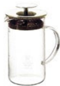
水出し茶ポット・リーフ LPL-5SV

材質：フタ・茶こしフレーム/ ポリプロピレン ホルダー/エラストマー フタパッキン/シリコンゴム メッシュ/ポリエステル バンド/ステンレス ハンドル/メラミン