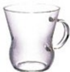
耐熱ウーロンマグ すき HUT-8T

C/T48 429444 幅 111・奥 87・高 95 口径 87 実用容量 240ml 満水容量 300ml