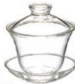
がいわん 蓋碗 GW-1T

C/T24 012349 幅 96・奥 95・高 70 口径 81 実用容量 220ml 満水容量 280ml