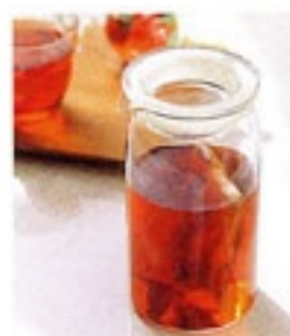
紅茶やアレンジティーにも