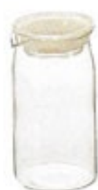
お茶パック 10 枚付き