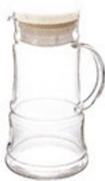
水出し茶ポット柄付き・竹 MDTE-7TW

材質：フタ・茶こしフレーム /ポリプロピレン メッシュ/ポリエステル フタパッキン/シリコンゴム