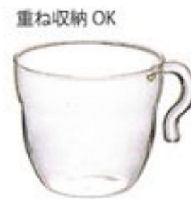
スタックカップ M STC-MT

C/T6 × 6 397545 幅 109・奥 80・高 70 口径 80 実用容量 160ml 満水容量 240ml