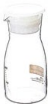
CAMPAIGN 受注単位：1C/T 水出し茶ポット・ミニ MDM-7TW

C/T24 632608 径 90・高 190 口径 74 実用容量 700ml 満水容量 830ml