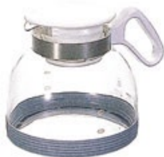
水出し茶ポット 1.8 MDB-18W

◎お手持ちの茶葉（煎茶や 深蒸し煎茶がおすすめ） と水を入れるだけ。シン プルで簡単に美味しい水 出し茶が作れます。