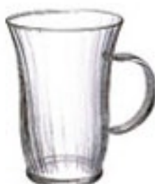
耐熱ホットグラス HGN-1K

C/T48 440067 幅 111・奥 87・高 95 口径 87 実用容量 240ml 満水容量 300ml