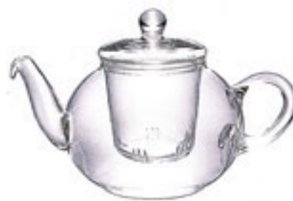
ドナウ N TDN-4

C/T12 711822 幅 195・奥 120・高 125 口径 68 実用容量 500ml 2杯用 満水容量 640ml