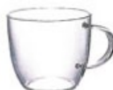
グラスマグカップ MG-8

C/T48 418738 幅 88・奥 55・高 130 口径 55 実用容量 225ml (8oz) 満水容量 260ml