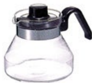
ティーポット・モーニング MO-3B

C/T24 314054 幅200・奥140・高140 口径95 実用容量600ml 3～4杯用 バンド下容量800ml