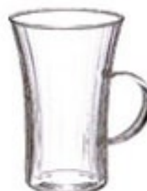
耐熱ホットグラス HGN-2K

C/T48 418714 幅 97・奥 76・高 107 口径 76 実用容量 200ml (7oz) 満水容量 240ml