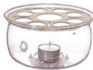
ティーウォーマー M TW-M

C/T24 412095 径 125・高 80 口径 123 キャンドル 1個付き 材質：天板 / ステンレス