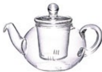
ドナウ N TDN-2

C/T12 711822 幅 195・奥 120・高 125 口径 68 実用容量 500ml 2杯用 満水容量 640ml