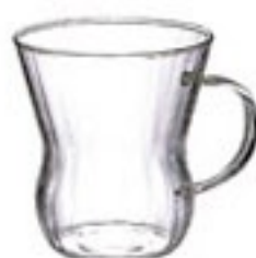
耐熱ウーロンマグ HUM-T

C/T48 429437 幅 88・奥 55・高 130 口径 55 実用容量 225ml (8oz) 満水容量 260ml