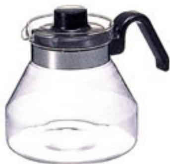
ティーポット・モーニング MO-5B

C/T24 314573 幅205・奥150・高160 口径95 実用容量900ml 5～6杯用 バンド下容量1,200ml