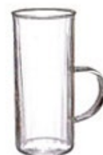
耐熱ホットグラス HGN-3K

C/T48 418721 幅 102・奥 77・高 117 口径 77 実用容量 225ml (8oz) 満水容量 280ml