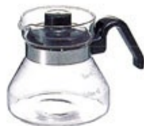
ティーポット・モーニング MO-2B

C/T24 314887 幅160・奥110・高110 口径77 実用容量300ml 2～3杯用 バンド下容量380ml