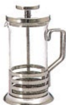
CAMPAIGN 受注単位：1C/T ハリオール・ブライト THJ-2SV

C/T12 105409 幅 110・奥 87・高 166 口径 73 実用容量 300ml 2杯用 満水容量 395ml