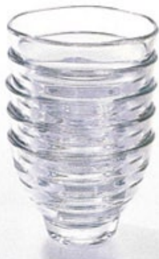
こうだいわん 耐熱高台碗 KW-1

C/T24 440210 カップ：幅 100・奥 77・高 67 口径 77 ソーサー：径 140 実用容量 150ml 満水容量 210ml ソーサーは耐熱ガラスではありません