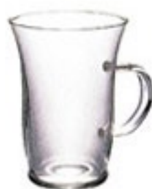
耐熱ホットグラス すき HGT-1T

C/T48 429444 幅 111・奥 87・高 95 口径 87 実用容量 240ml 満水容量 300ml