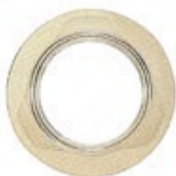
パッキン付きのフタ