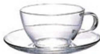
耐熱ティーカップ&ソーサー TCS-1T

C/T24 440227 幅 114・奥 85・高 75 口径 85 実用容量 240ml 満水容量 300ml