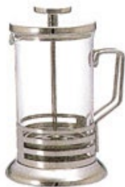
CAMPAIGN 受注単位：1C/T ハリオール・ブライト THJ-4SV

C/T12 105416 幅 139・奥 113・高 183 口径 90 実用容量 600ml 4杯用 満水容量 710ml