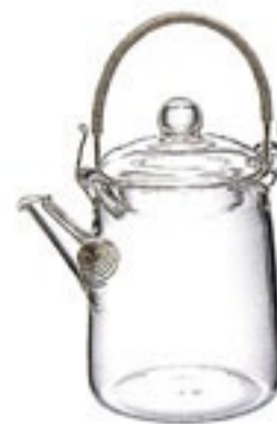
アジアン急須 筒形 QSA-1SV

C/T24 396913 幅 120・奥 80・高 155 口径 59 実用容量 220ml 1~2杯用 満水容量 320ml