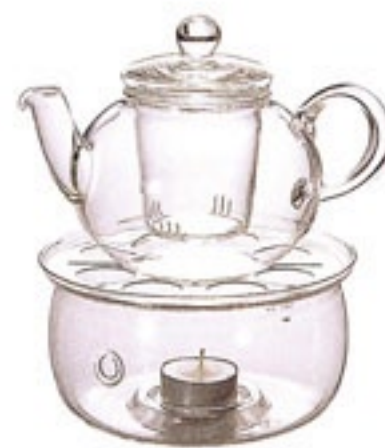
ドナウキャンドルセット N TDCN-6512

C/T24 711655 径 152・高 80 口径 152 キャンドル 1個付き 材質：天板 / ステンレス