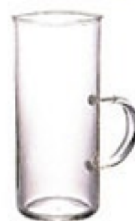
耐熱ホットグラス すき HGT-3T

C/T48 429420 幅 102・奥 77・高 117 口径 77 実用容量 225ml (8oz) 満水容量 280ml