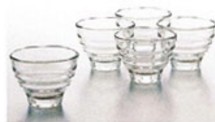
こうだいわん 耐熱高台碗 五客組み KW-2012

C/T12 389915 KW-1 × 5客 実用容量 120ml 満水容量 170ml