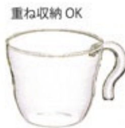
スタックカップ S STC-ST

C/T6 × 6 440234 幅 84・奥 65・高 45 口径 65 実用容量 50ml 満水容量 90ml