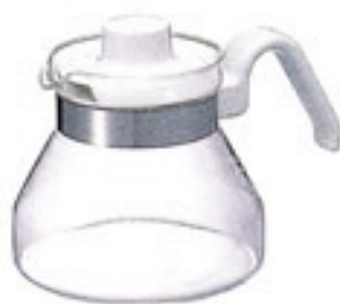
ティーポット・モーニング MO-3W

C/T24 314047 幅200・奥140・高140 口径95 実用容量600ml 3～4杯用 バンド下容量800ml