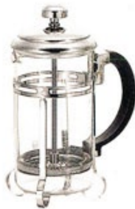
ハリオール・オーレ THA-4SV

材質：フタ・シャフト・フィルター式・ホルダー / ステンレス フタツマミ / 亜鉛合金 ハンドル / フェノール