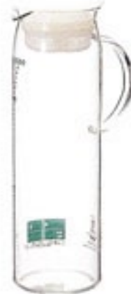
CAMPAIGN 受注単位：1C/T 水出し茶ポット・ピュア MDP-10TW

材質：フタ・茶こしフレーム /ポリプロピレン メッシュ/ポリエステル フタパッキン/シリコンゴム