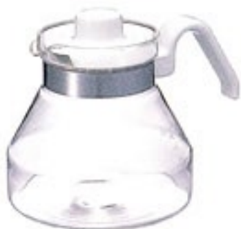
ティーポット・モーニング MO-5W

C/T24 314566 幅205・奥150・高160 口径95 実用容量900ml 5～6杯用 バンド下容量1,200ml