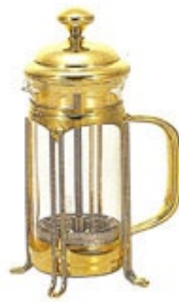
ハリオール・エレガンス THE-2GD

材質：フタ・シャフト・フィルター式・ホルダー / ステンレス フタツマミ / 亜鉛合金 ハンドル / フェノール