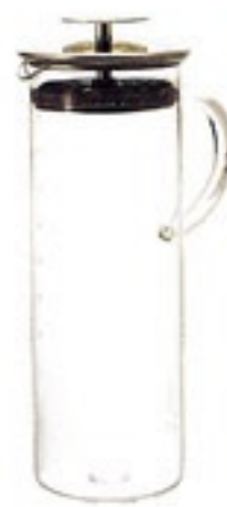
水出し茶ポット・リーフ LPL-10SV

C/T18 034129 幅 135・奥 95・高 260 口径 90 実用容量 1,000ml 満水容量 1,140ml