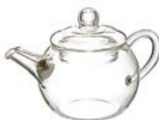
アジアン急須 丸形 QSM-1

C/T24 397705 径 90・高 95 口径 84 実用容量 85ml 満水容量 145ml