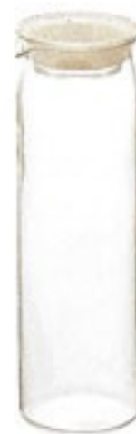
お茶パック 10 枚付き

C/T24 044609 幅 84・奥 82・高 160 口径 76 実用容量 500ml 満水容量 650ml 材質：パッキン/シリコンゴム