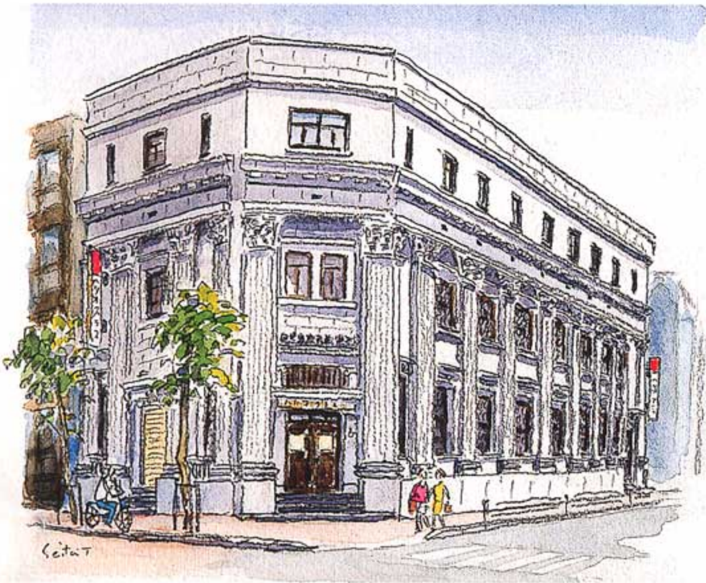
日本橋本社ビル（登録有形文化財）